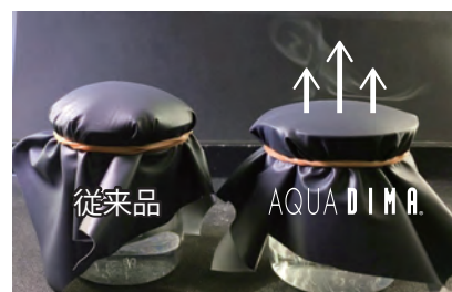
従来品(左)と AQUA DIMA。(右)の透湿性比較