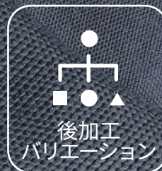
後加工 バリエーション