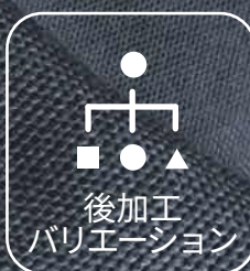
後加工 バリエーション