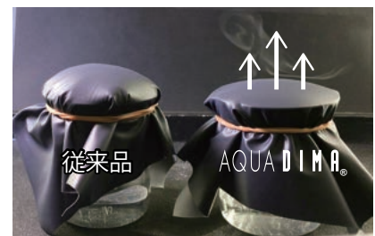
従来品(左)と AQUA DIMA®(右)の透湿性比較