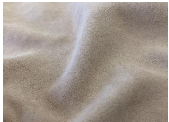
コマスエードの外観

従来市場で発売されているスエード素材に比べ、独自のボリューム感、弾力性とマイルドな触感に加えて、これまでになくエアリーで手に吸い付くようなタッチの高級スエード感が特徴です。