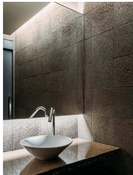
「AROMABIZ」の施工例（小松精練 研究施設「fa-bo（ファーボ）」トイレ内壁面に使用）