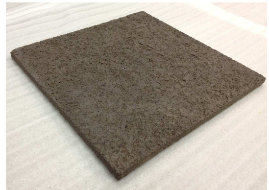
AROMABIZ (アロマビズ) 245mm x 245mm x 厚み 10mm タイプ